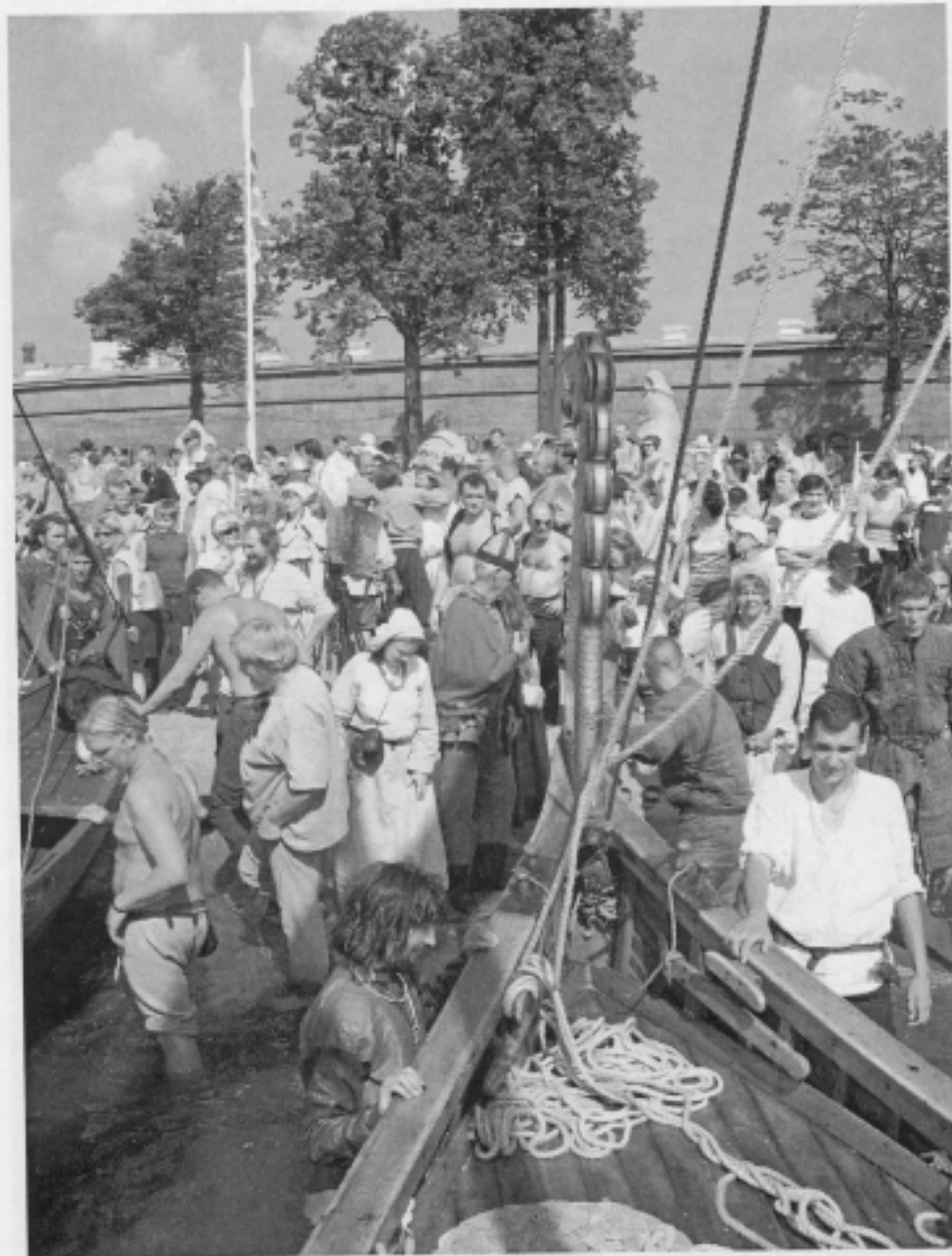
Stort folkmyller välkomnade vikingaskeppen till stranden vid Peter-Paulsfästningen i centrala S:t Petersburg. På bilden ses Viking Plyms stäv med drakhuvudet i samband med landstigningen.