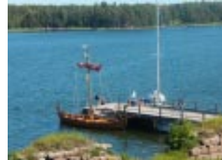
Bryggan vi låg vid