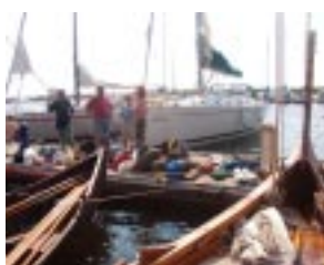
Rengöring av Tälja