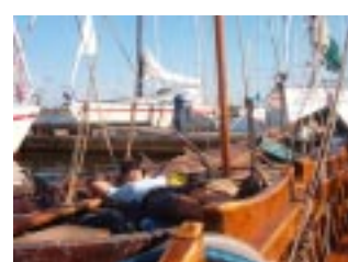
Vilopaus i Kotka