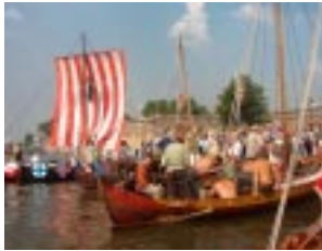
Mycket folk i land.