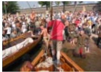
Från Viking Plym får man vada