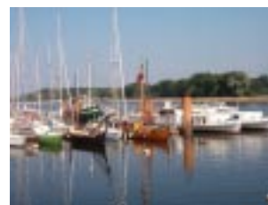
Central River Yacht Club

Dagen ägnas åt sightseeing men tyvärr var Erimitaget stängt.