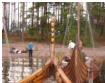
Stranden på Björkö

Vi anländer Ryska Björkö 17 30 rysk tid (16 30 finsk tid). Stranden är långgrund med många stenar och visar sig omöjlig för VP att angöra. Ankrar en bit ut med dubbla ankare men fortfarande endast några decimeter under kölen. Kraftigt åskväder dyker hastigt upp när Tälja skall hämta besättning på VP. Vinden ökar till 15-20 m/sek och sikten reduceras till 200 m. VP tar upp ankarna och lämnar snabbt den grunda viken och rider ut den haltimmes långa åskskuren med störtregn och blixtrar på säkert vatten. Regnet var så kraftigt att det piskade ner vågornas vita gäss att det liknade olja på lungt vatten trots att vinden tjöt i rigg och tåg.