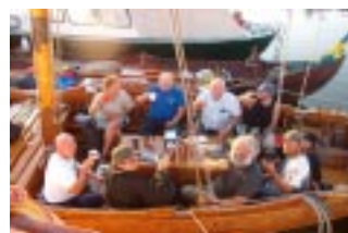
Kvällfilosofi på Fagerö