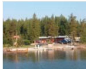
Som det syns från färjan