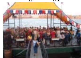
Utgångsplats för turistbåt