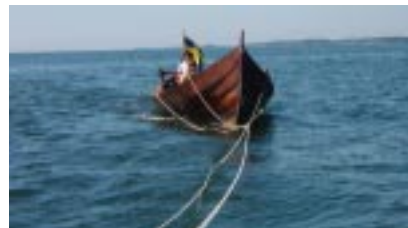
Tälja i bakvatten