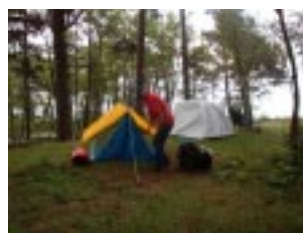
Tältplats på Västra Fagerö