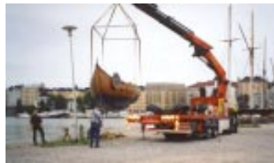
Viking Plym i Helsingfors