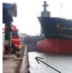
Viking Plym är liten

Vi förtöjde vid en jättehög kaj och klev ombord på Alsen som senare skulle ta oss till Sverige 23 30 . Hamnen låg c:a 15 nm från fortet. Fem vikingar fick sig tilldelade två sängar i två hytter varvid en var sjukhytt samt utrymme på durken.