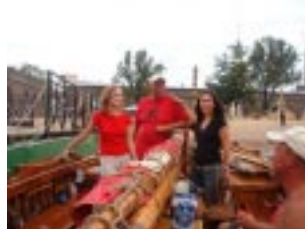
Turister i sista stund