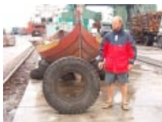
Däck som ramlade på Regin

Regnväder. Däckslasten av timmer är på plats och vid 12 tiden lyfts även skeppen dit. En jättestor hamnkran lyfter ett skepp medan en annan lyfter däcken allt medan regnet öser ner. När skeppen är