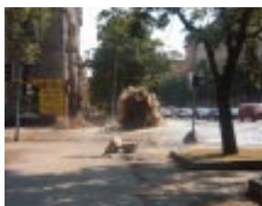
Fontän i gatan