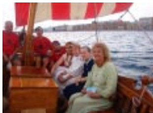
Sista segeltur med Viking Plym