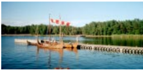
Bryggan i Santio

en timma senare. Klarerar ut medan tullbåt hämtar gott dricksvatten. Övernattar på udden efter tillstånd, intar grillmiddag marinerad laxröra, kyckling mm. tillsammans med övriga båtbesättningar. Färdskepparen på VP vet ej vilket tält av 5 likadana han ska sova i, sover ombord.