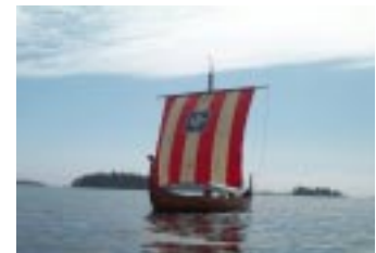
En av Magnus bilder från motorbåt