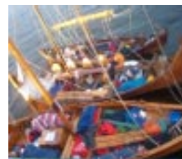
Vid 07 00 den 25 juli

Trots löfte om att endast klarera in på ett ställe är vi tvugna att infinna oss en andra gång i S:t Peterburg morgonen därpå. Vi är med andra ord i karantän i 12 timmar. Middag bestående av gulasch-röra och potatismos avnjöts 22 00 . Efter samkväm ombord med sång och mycket skratt insomnade sjörullade, solbrända och trötta vikingar ombord under bar himmel 24 30 . Dagens etapp blev 51 nm.