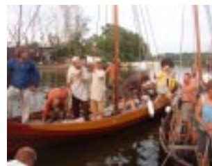
Regin i hamn