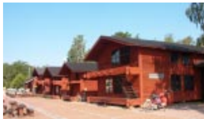
Skeppsbron i Lovisa