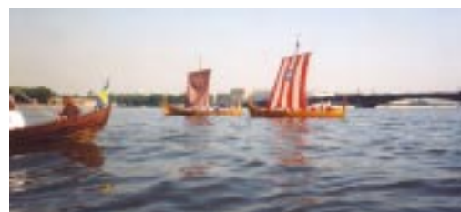
Vem kan segla förutan vind..