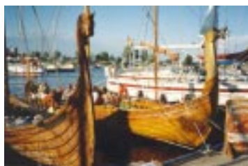
Kotka Yacht Club